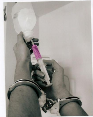
TÍTULO: ESPOSADOS AUTOR: Rafael Rubio Vidal