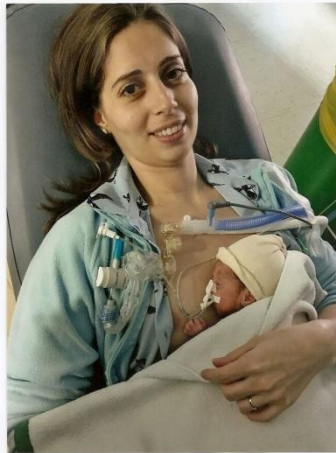
TÍTULO: LO MEJOR DEL DÍA AUTOR: Mª Antonia Bravo Pérez