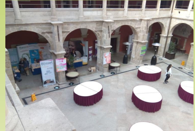
La Jornada en prensa